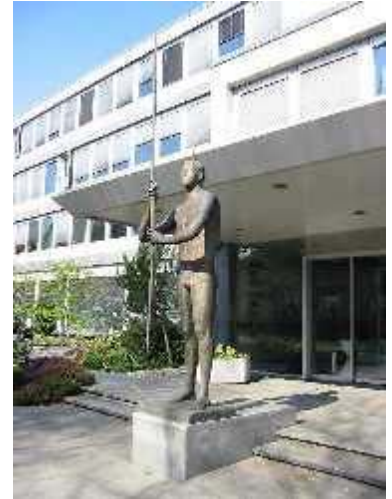
Eingang Haus des Sportes, Bern